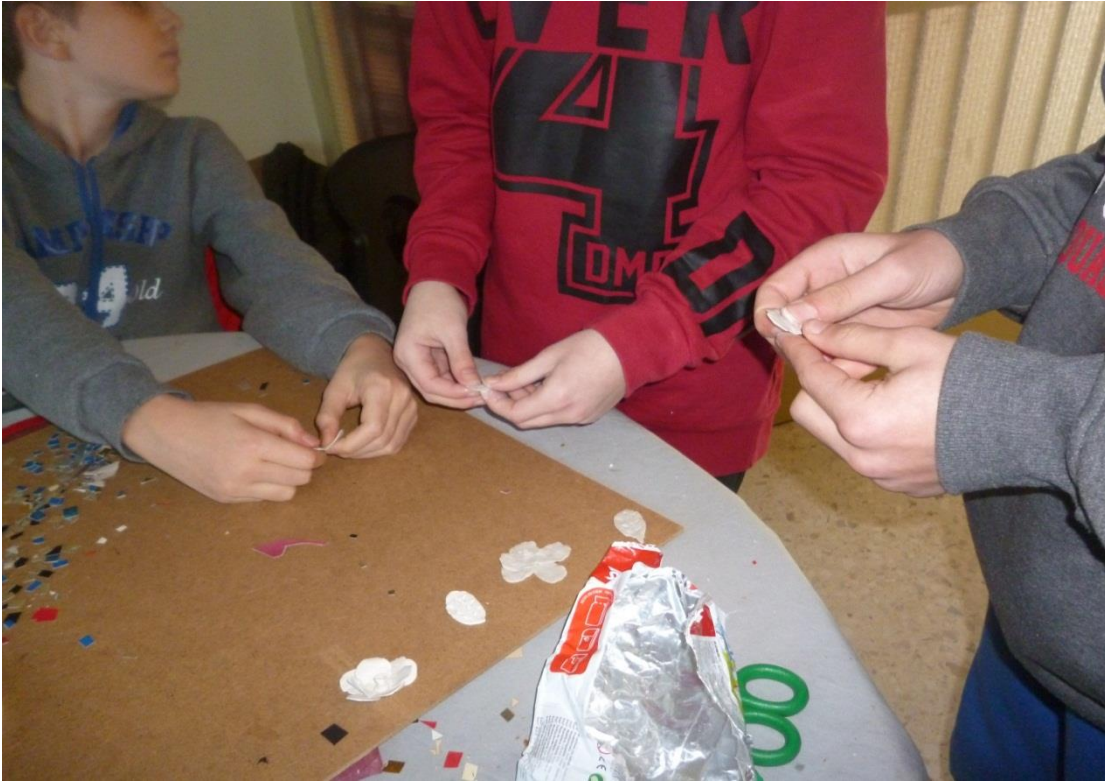
Κατασκευές με πηλό για το ψωμί της νύφης