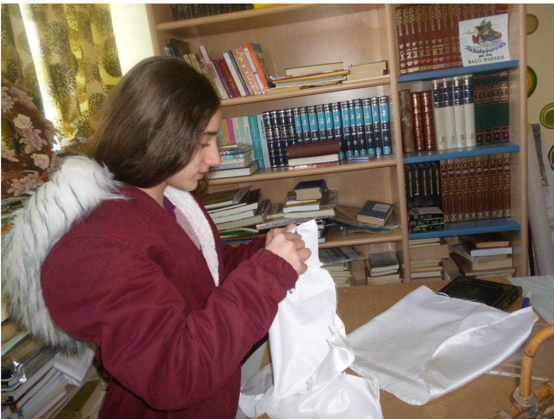
Ράβουμε το νυφικό