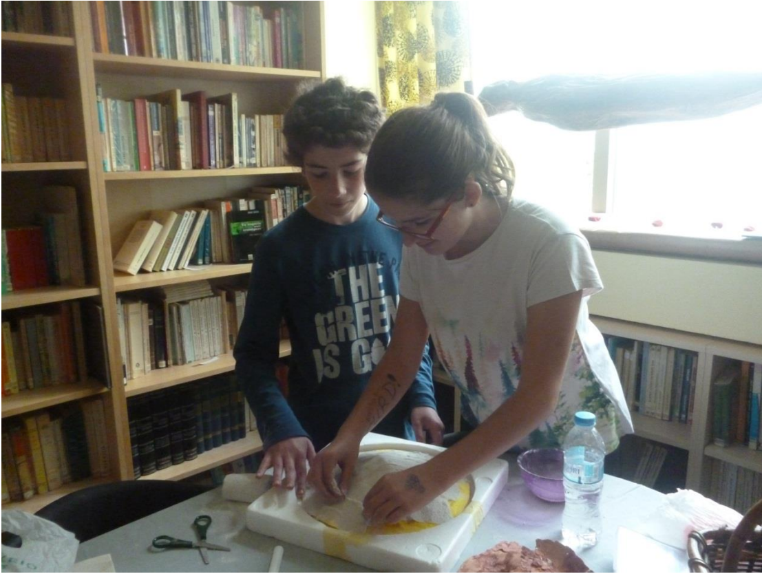
Η βάση της ασπίδας του Αχιλλέα