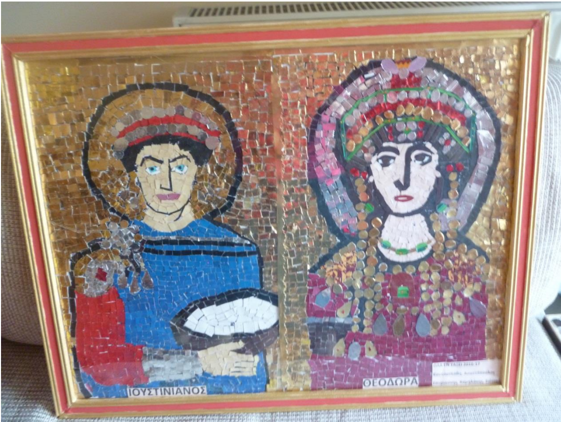
Ιουστινιανός και Θεοδώρα